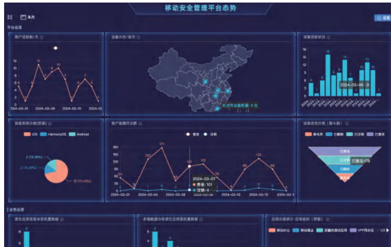
企业移动安全管理态势