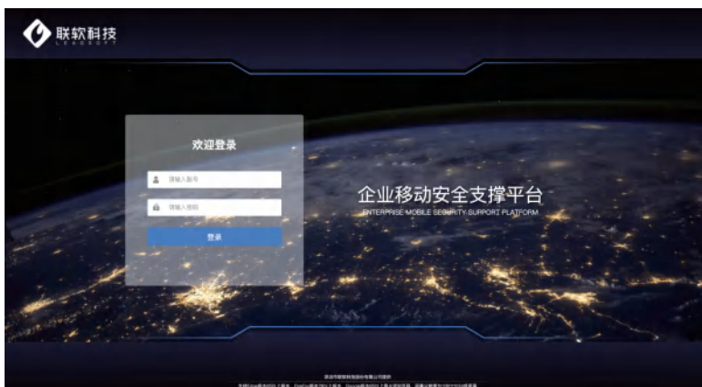
企业移动安全管理平台登录